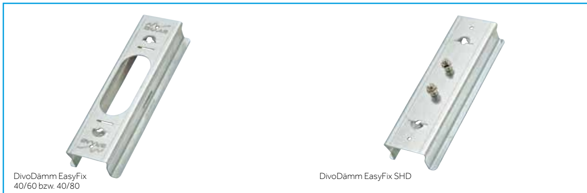
DivoDämm EasyFix 40/60 bzw. 40/80