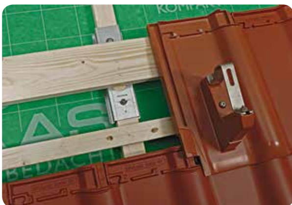
Beispiel: DivoDämm EasyFix mit Modulstütze