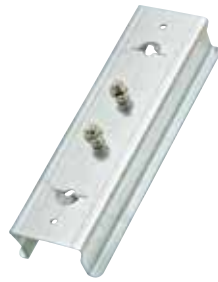
DivoDämm EasyFix SHD