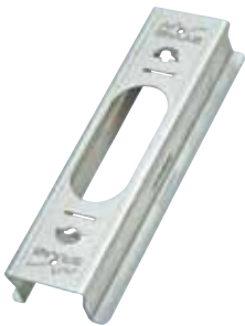
DivoDämm EasyFix 40/60 bzw. 40/80